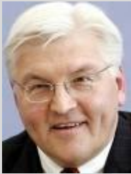
Schirmherr der Europäischen Bürgerkonferenz in Deutschland Bundesaußenminister Frank-Walter Steinmeier